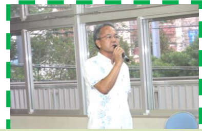
1 部司会の国吉副会長です

平成25年9月6日(金)にそてつまつりが行われました。 利用者、保護者、来賓の方々に約200名の参加があり、 美味しい料理や余興で盛り上がりました。 保護者の皆さま、準備から片づけまでご協力、有難うござ いました。