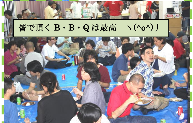
皆で頂く B・B・Q は最高 \ (^o^ ) /