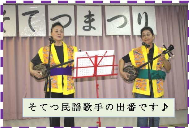
そてつ民謡歌手の出番です♪