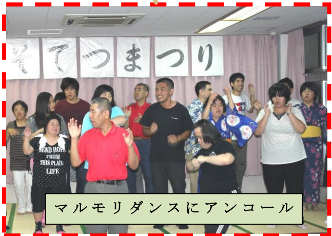
マルモリダンスにアンコール