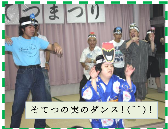
そてつの実のダンス!(^^)!