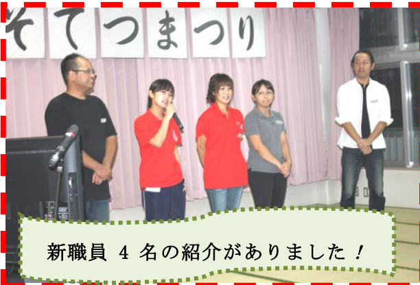
新職員 4 名の紹介がありました！