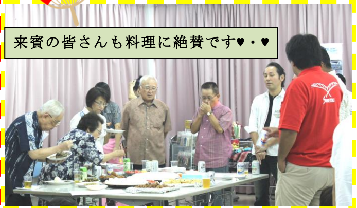
来賓の皆さんも料理に絶賛です♥・♥