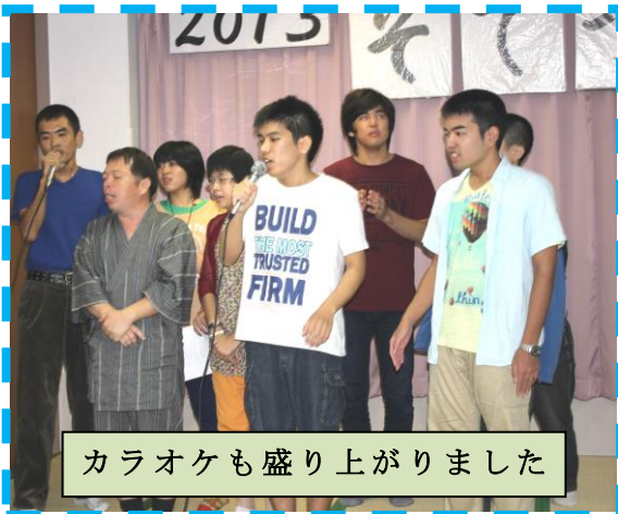
カラオケも盛り上がりました