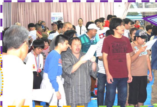
全員で♪♪ 明日を信じて を熱唱しました〜♪