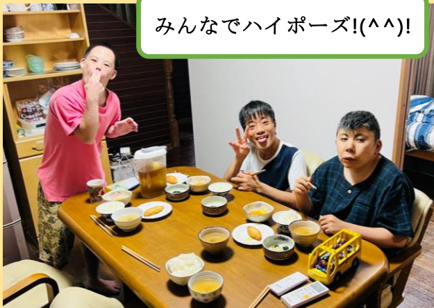
みんなでハイポーズ!(^^)!

5月25日に『短期入所事業所 レストケアそてつ』が那覇市山下町8-28に開所しました。家族の怪我や病気、または介護する方の休息（レスパイトケア）が必要な際、障がいのある方を短期間受け入れ、入浴や排せつ及び食事の介護、その他必要な支援を行なうことを目的とした事業となっております。少しずつ利用者さんの受け入れをスタートしており、「お泊まり」を楽しみにしている利用者さんも増えつつあります。