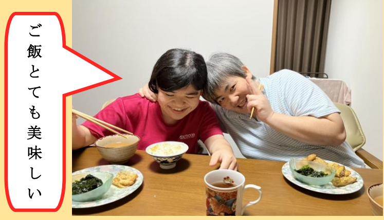
ご飯とても美味しい