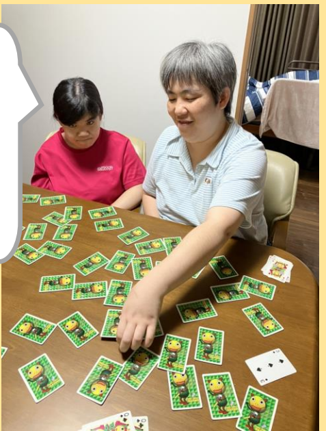
トランプ勝負だ！ 誰がたくさんカードを とれるかな(笑)